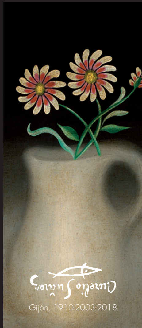
JARRO CON FLORES CERÁMICAS, 1951

... Para conseguir esta clase de pintura son precisas mucha imaginación y gran cultura, tanto literaria como científica. Leo mucho, soy absolutamente autodidacto y no he asistido jamás a ninguna Escuela Oficial de Arte.