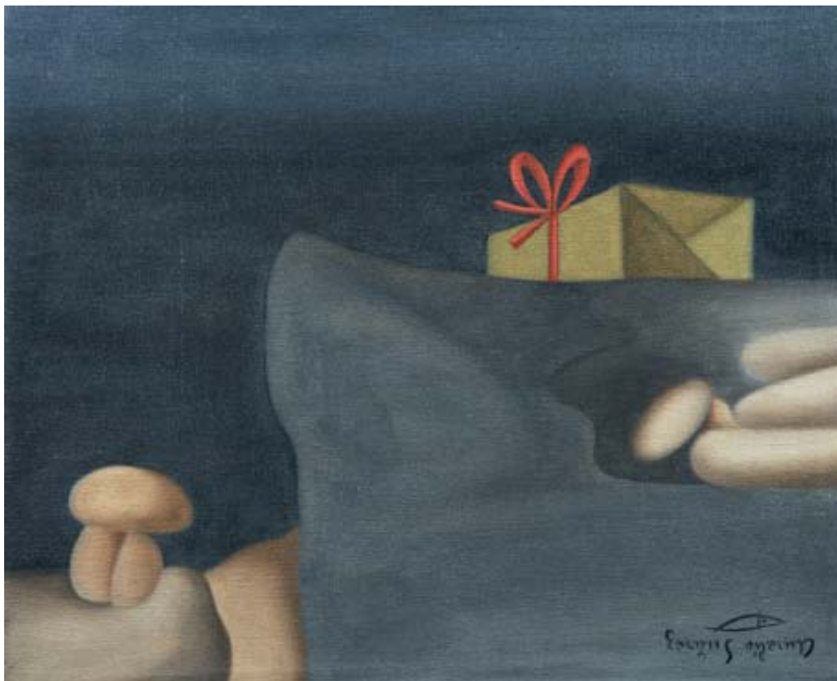
OBSEQUIO PARA ELLA, 1959. Óleo sobre lienzo; 38 x 46 cm [Cat. núm. 26]