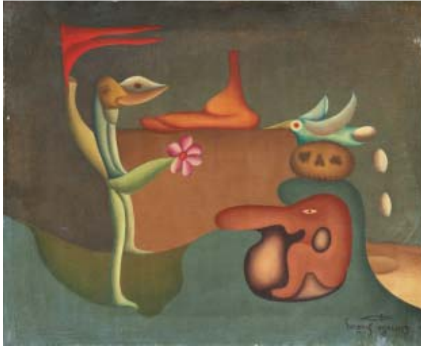
HOMOFLORES HÓRRIDAS, 1954. Óleo sobre lienzo; 38 x 46 cm [Cat. núm. 21]