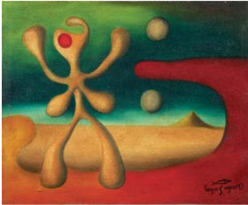
NOCHE CON DOS LUNAS, 1943. Óleo sobre lienzo; 38 x 46 cm [Cat. núm. 6]