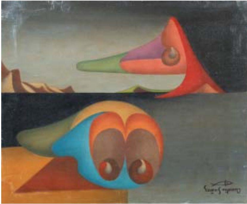
HIDROPÍLFIDOS FLOTANTES, 1948. Óleo sobre lienzo; 38 x 46 cm [Cat. núm. 14]