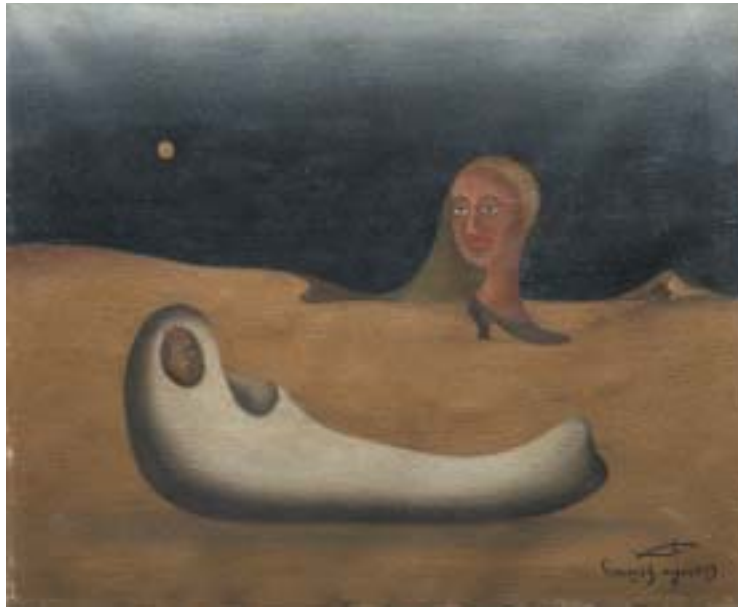
BAJO EL TECHO DE LA NOCHE, 1955. Óleo sobre lienzo; 38 x 46 cm [Cat. núm. 23]