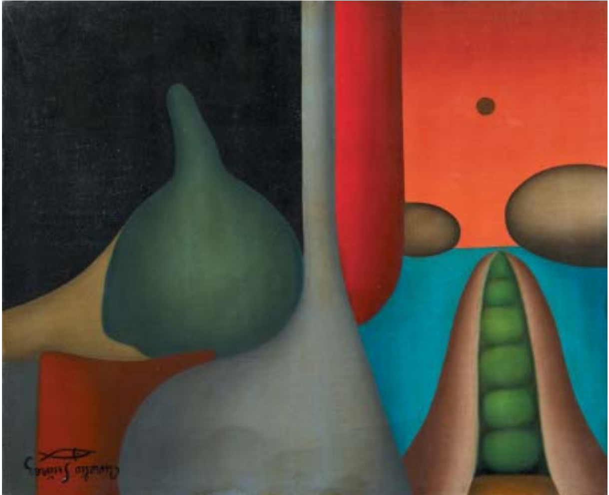
OCTAVA CREACIÓN, 1953. Óleo sobre lienzo; 38 x 46 cm [Cat. núm. 18]