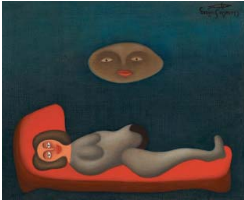
LUNAFILIA, 1954. Óleo sobre lienzo; 38 x 46 cm [Cat. núm. 20]