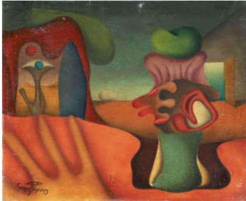
VIDA MUERTA, 1939. Óleo sobre lienzo; 38 x 46 cm [Cat. núm. 1]