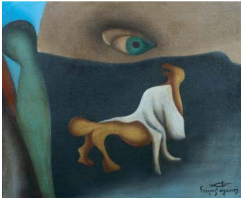
AMORIMORFUS AL RELENTE, 1955. Óleo sobre lienzo; 38 x 46 cm [Cat. núm. 22]