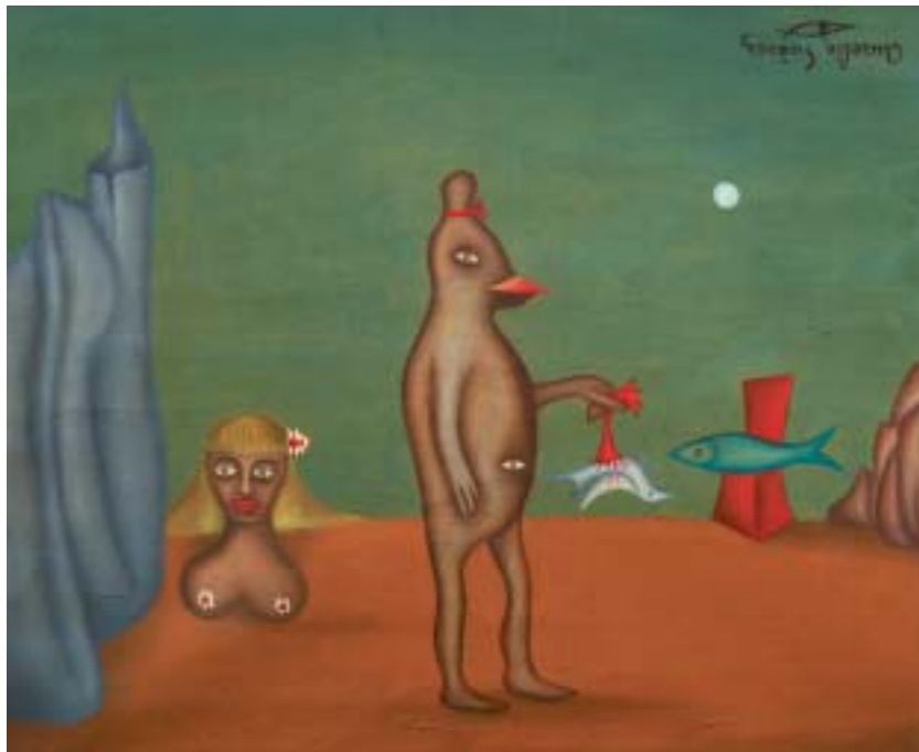
JUAN CARNECRUDA, 1953. Óleo sobre lienzo; 38 x 46 cm [Cat. núm. 19]