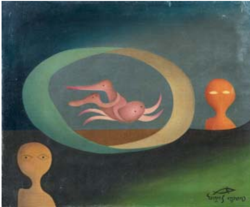
GALOPE DEL TIEMPO, 1948. Óleo sobre lienzo; 38 x 46 cm [Cat. núm. 13]