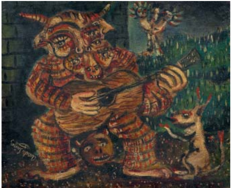
TAÑEDOR DE GUITARRA, 1942. Óleo sobre lienzo; 38 x 46 cm [Cat. núm. 4]