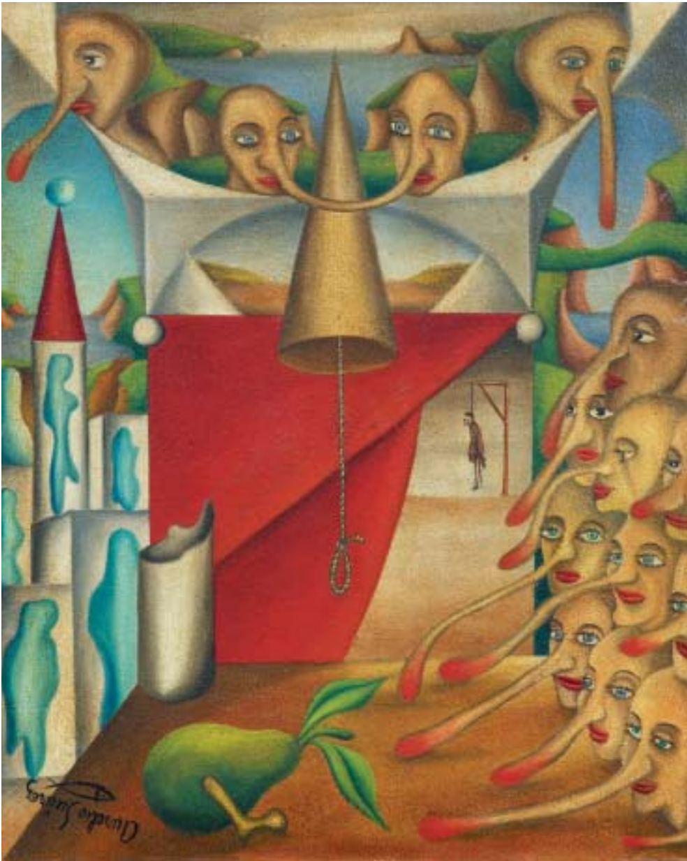
OLOR A SOGA, 1947. Óleo sobre lienzo; 38 x 46 cm [Cat. núm. 12]