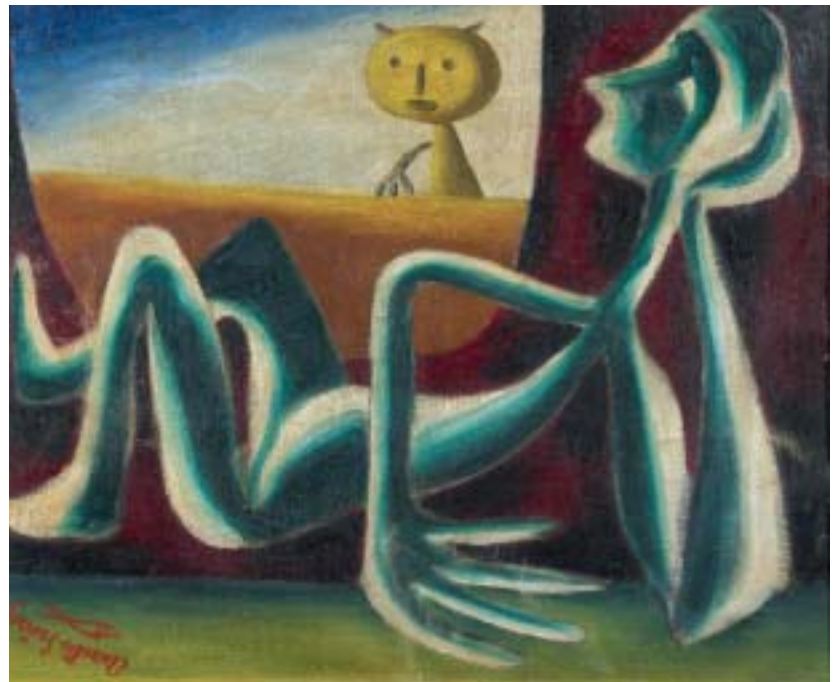
SUEÑO, 1949. Óleo sobre lienzo; 38 x 46 cm [Cat. núm. 15]