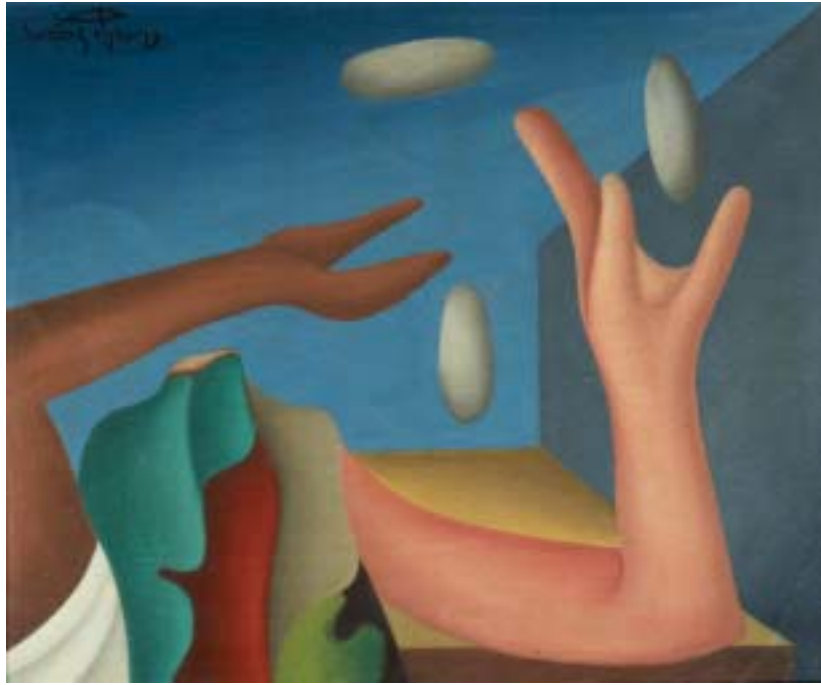
MALABARISTA, 1947. Óleo sobre lienzo; 38 x 46 cm [Cat. núm. 11]