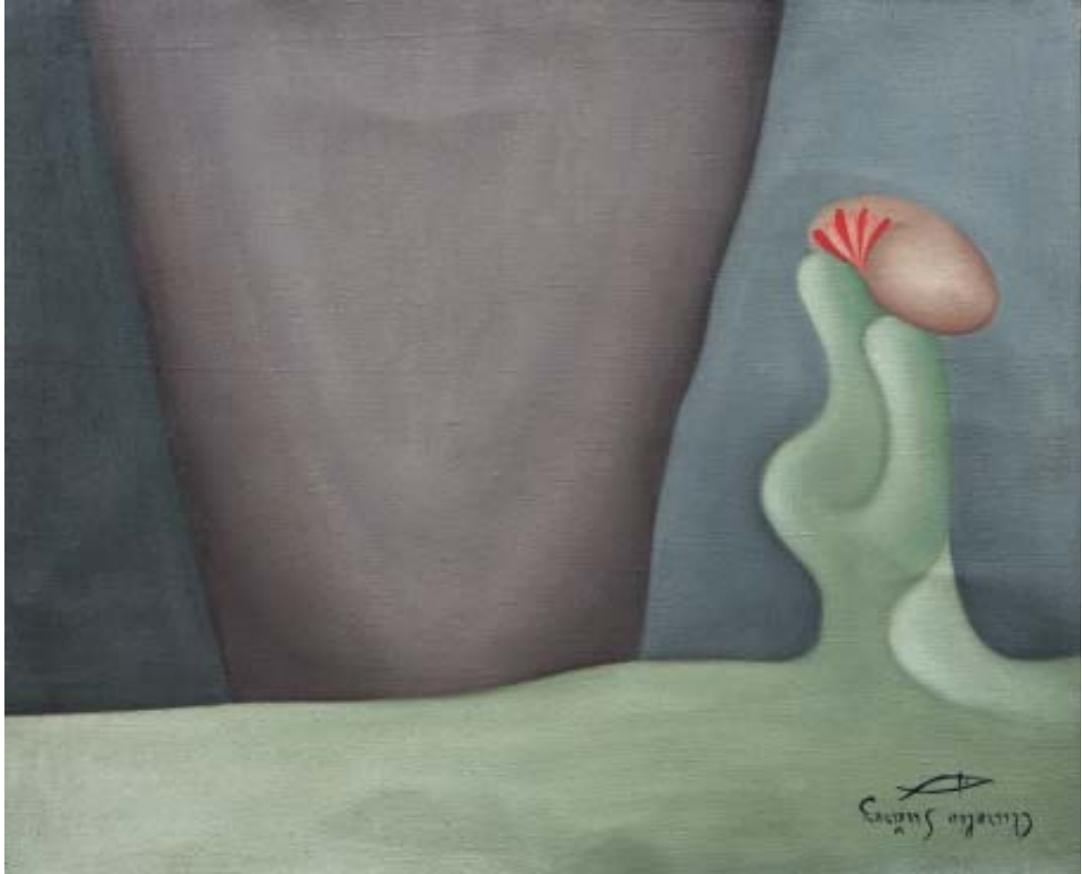
FLORICANO, 1958. Óleo sobre lienzo; 38 x 46 cm [Cat. núm. 24]