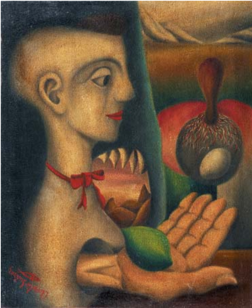
SOLA EN SÍ, 1942. Óleo sobre lienzo; 38 x 46 cm [Cat. núm. 5]