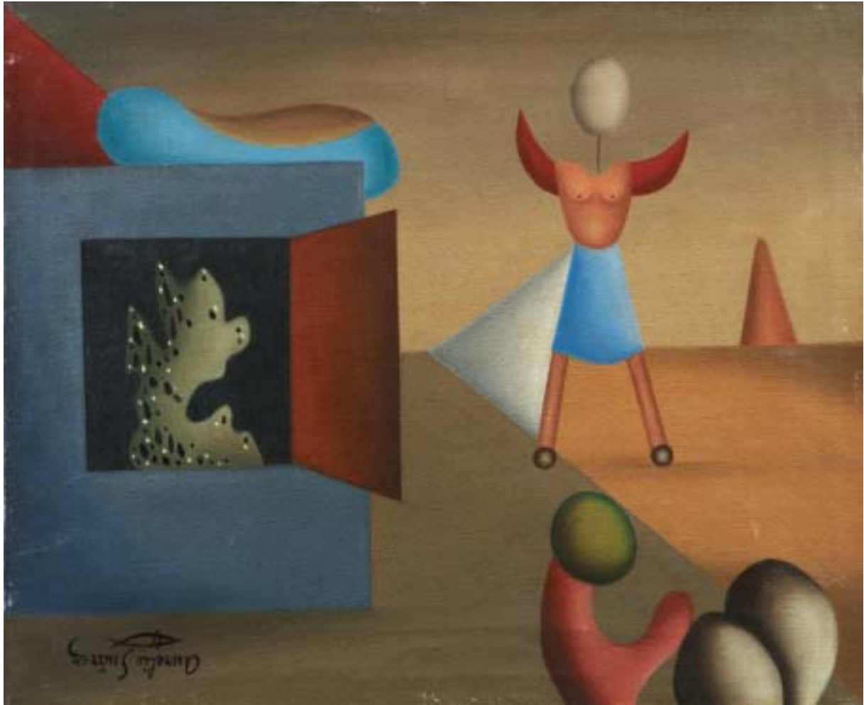
DOÑA MEDIA LUNA, 1945. Óleo sobre lienzo; 38 x 46 cm [Cat. núm. 8]