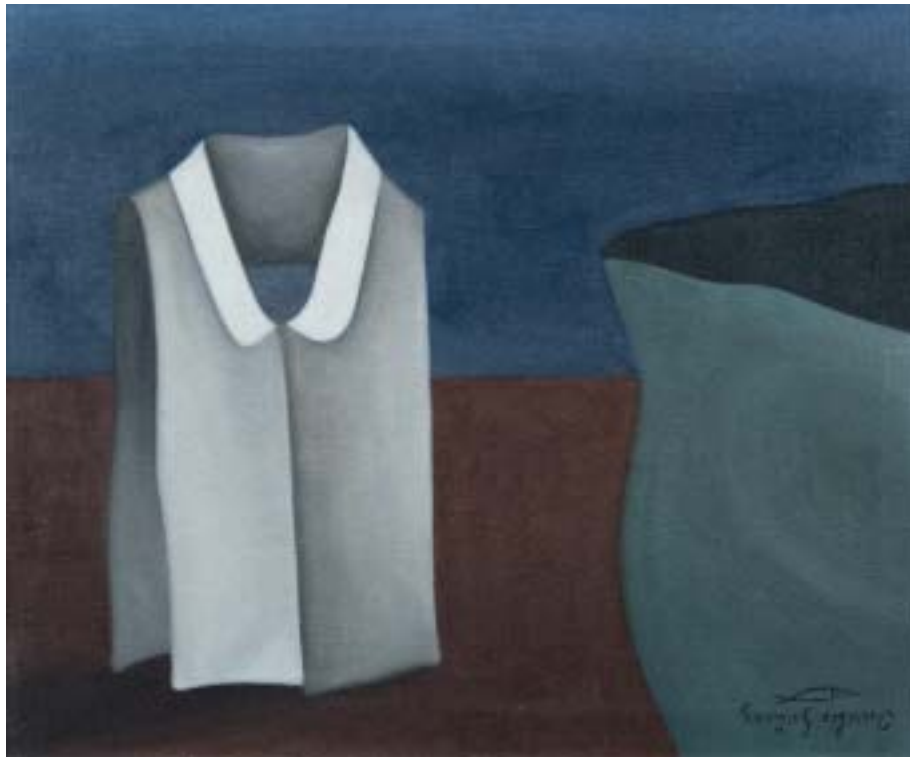
FALSA BLUSA, 1959. Óleo sobre lienzo; 38 x 46 cm [Cat. núm. 25]