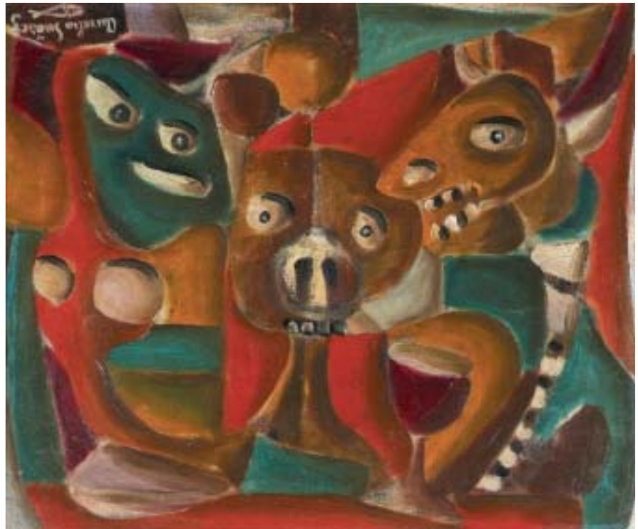
TERCETO, 1949. Óleo sobre lienzo; 38 x 46 cm [Cat. núm. 16]