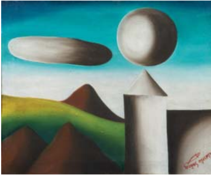
NOCHE SIDERAL, 1940. Óleo sobre lienzo; 38 x 46 cm [Cat. núm. 3]