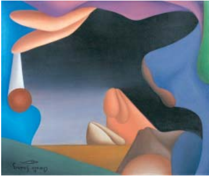
CONCAVIDAD, 1953. Óleo sobre lienzo; 38 x 46 cm [Cat. núm. 17]