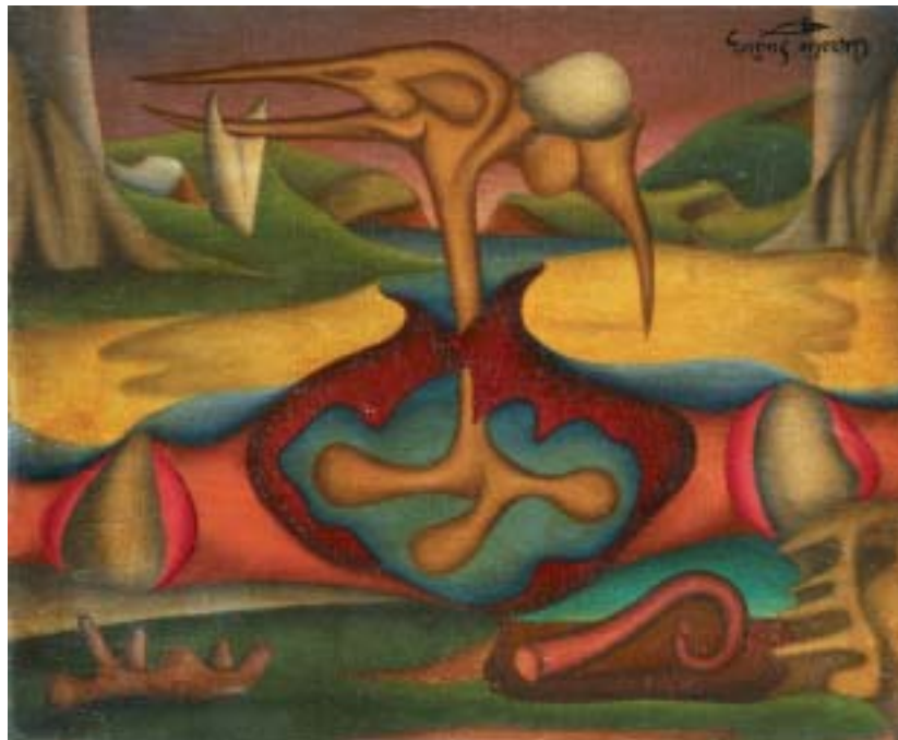
TODO FUE, 1939. Óleo sobre lienzo; 38 x 46 cm [Cat. núm. 2]