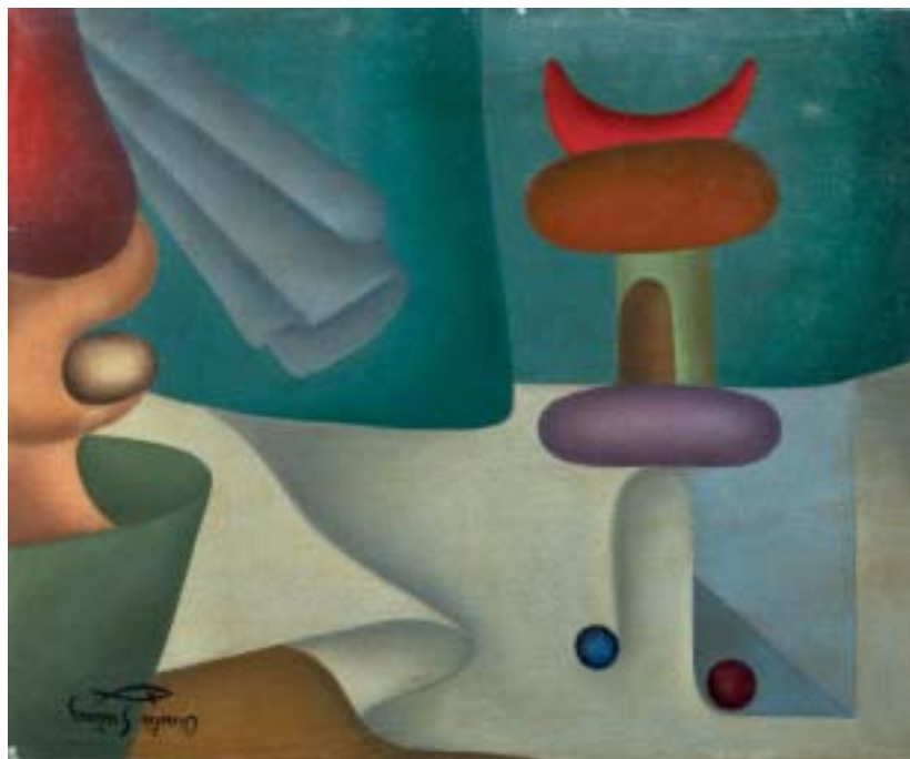
FIGURAS CONCRETAS, 1946. Óleo sobre lienzo; 38 x 46 cm [Cat. núm. 10]