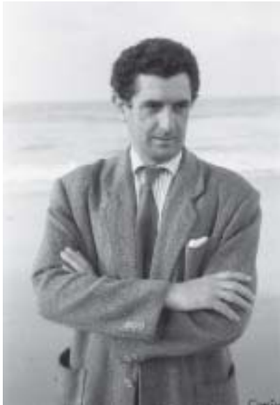
Playa San Lorenzo. Gijón, 1958.

última exposición una crítica de donde podemos destacar los rasgos que seguirán permaneciendo fieles en el espíritu de su obra: