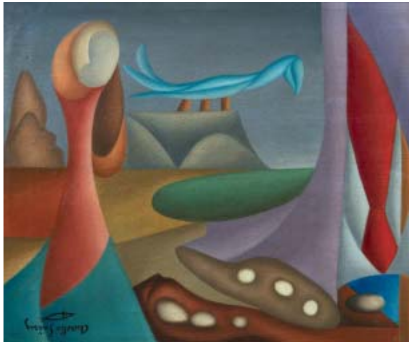
ESCONDRIJO CON HUEVOS DE AVE, 1945. Óleo sobre lienzo; 38 x 46 cm [Cat. núm. 9]