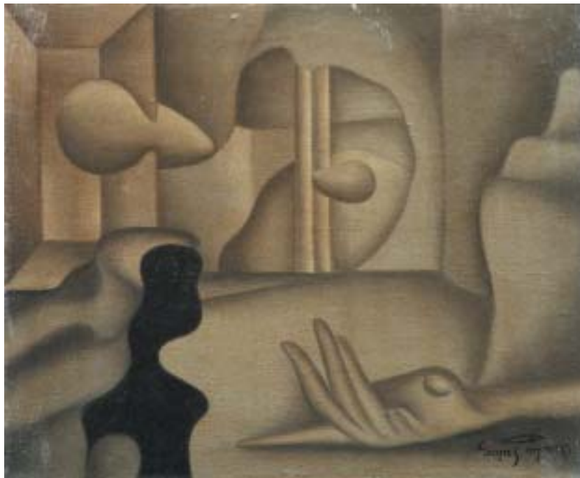
ESPECTRO DEL PASADO, 1943. Óleo sobre lienzo; 38 x 46 cm [Cat. núm. 7]